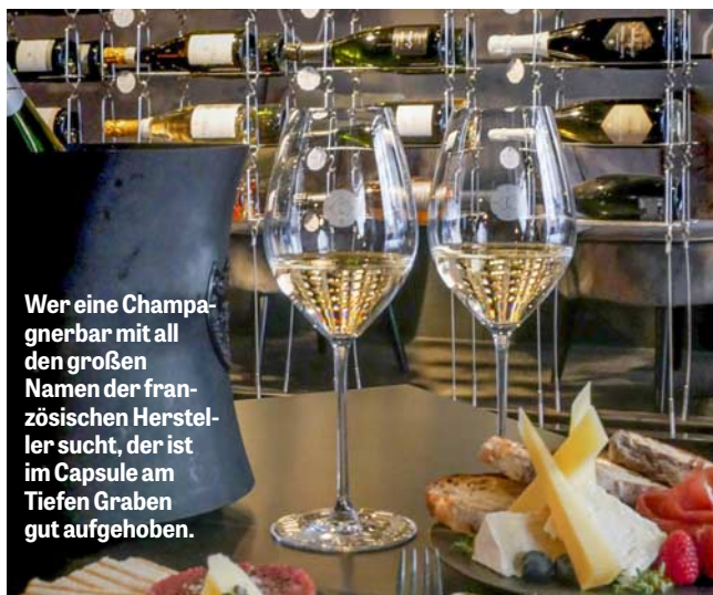
Wer eine Champagnerbar mit all den großen Namen der französischen Hersteller sucht, der ist im Capsule am Tiefen Graben gut aufgehoben.