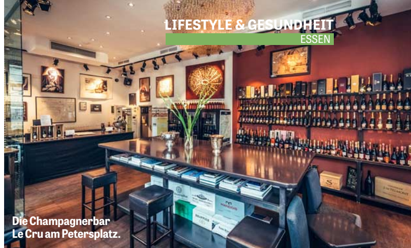
Die Champagnerbar Le Cru am Petersplatz.